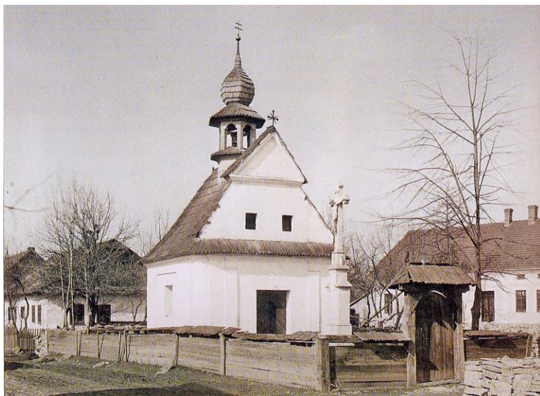
Původní kaple z roku 1765

Kaple byla dostatečně vybavena bohoslužebnými předměty i vlastním jměním na její pečlivé udržování. Farníci sice usilovali o zvětšení kaple, chyběl však jednak potřebný pozemek a pak tamější farní společenství by bylo příliš odloučeno od farního kostela a společného náboženského života.