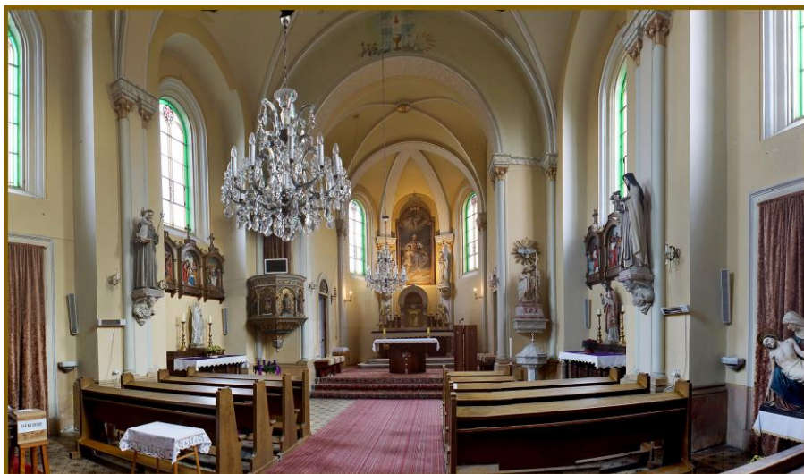
Současný interiér Kostela sv. Josefa ve Starém Městě

Kostel, to ovšem není jen hmotná stavba svatyně, ale celé generace lidí, kteří k němu patří, kteří do něho přicházejí a mají jej rádi, je jim blízký. Vytvářejí farní rodinu, v níž jsou někdy spory, ale silnější by mělo být pouto vzájemné duchovní příbuznosti. V něm si věřící víru uchovávají a stále rozvíjejí. Prožívají tu společenství víry a modlitby. Kostel představuje malou církev, je prostředím, které trvale nabízí možnost zakoušet setkání Boha